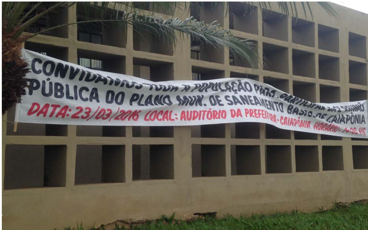
Figura 4. Faixa convidando a população de Caiapônia para a reunião do Prognóstico.