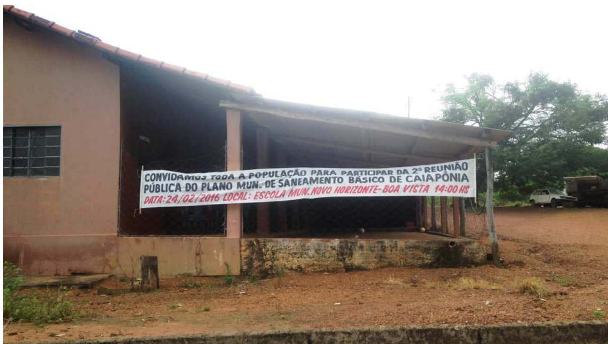
Figura 5. Faixa convidando a população do povoado Boa Vista e Região para a reunião do Prognóstico.