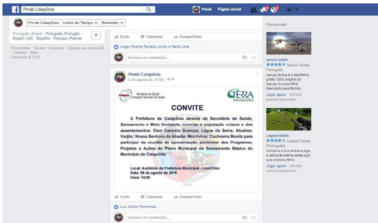
Figura 1. Convite na página do facebook para a reunião na sede de Caiapônia.

Os trabalhos de divulgação iniciaram nas redes sociais como facebook e whats App, onde foram divulgados convites das três reuniões que abrangeram todo o município (figuras 1).