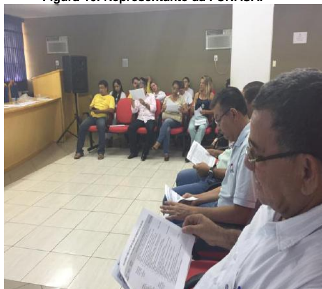
Figura 12. População com as tabelas dos PPAs.

A metodologia utilizada nos Programas, Projetos e Ações – PPA se diferiu das utilizadas nas demais reuniões, foi feita uma apresentação inicial para as pessoas que porventura nunca participaram das reuniões do PMSB e logo passou-se para a Projeção das Metas e objetivos de cada vertente na parede do auditório.