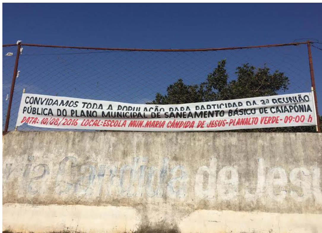
Figura 6. Faixa utilizada para divulgação no povoado Planalto Verde.