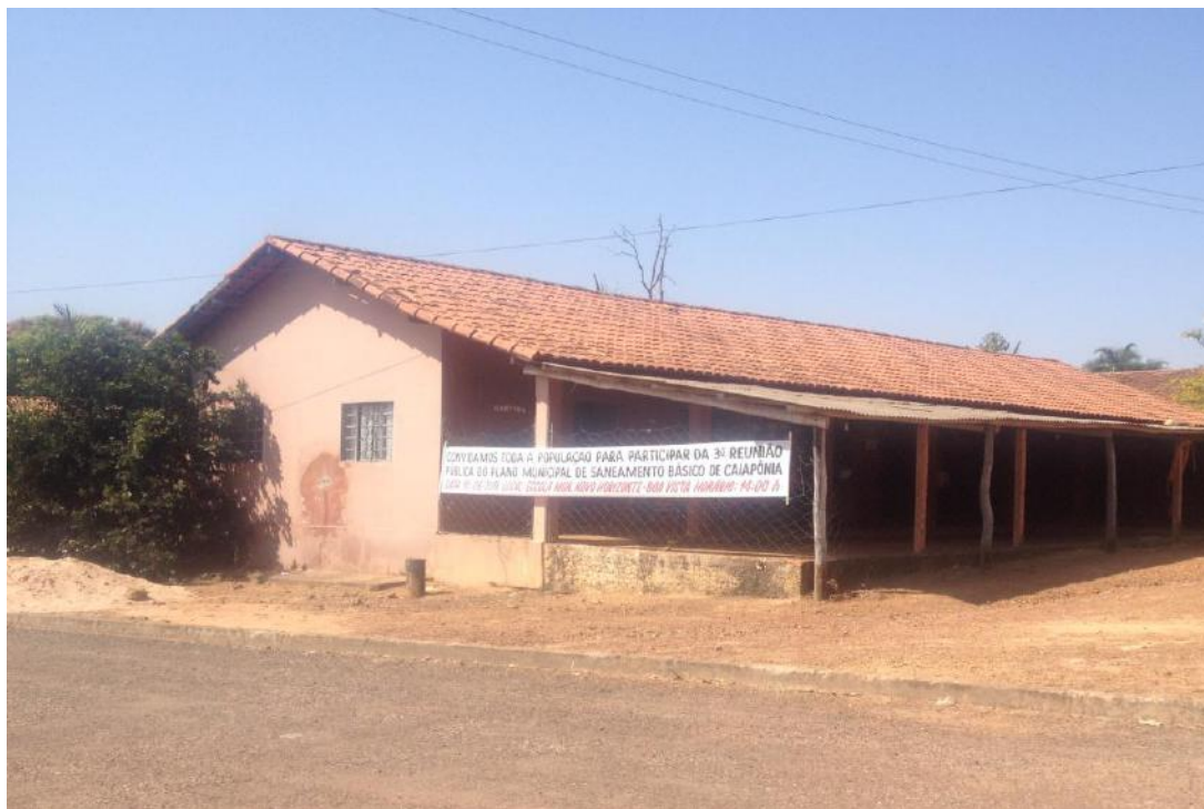
Figura 5. Faixa utilizada para Divulgação do Produto E em Boa Vista.