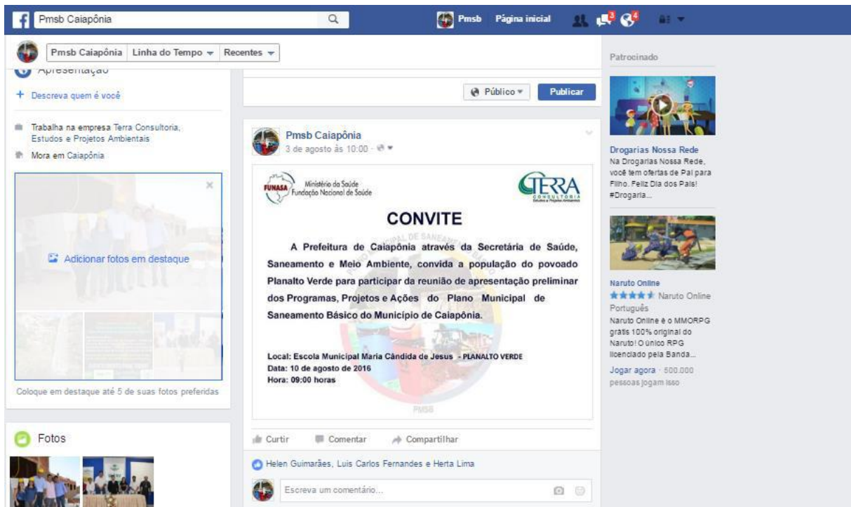
Figura 2. Convite na página do facebook para a reunião no Planalto Verde.