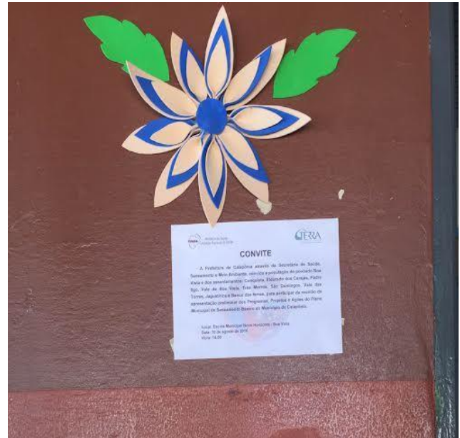
Figura 8. Convite anexado na parede da escola de Boa Vista.

No dia 08 e 09 de agosto, o convite foi reforçado por meio de carro de som para toda a população de Caiapônia, o anúncio informava a importância do Plano de Saneamento, bem como horário e local das reuniões.