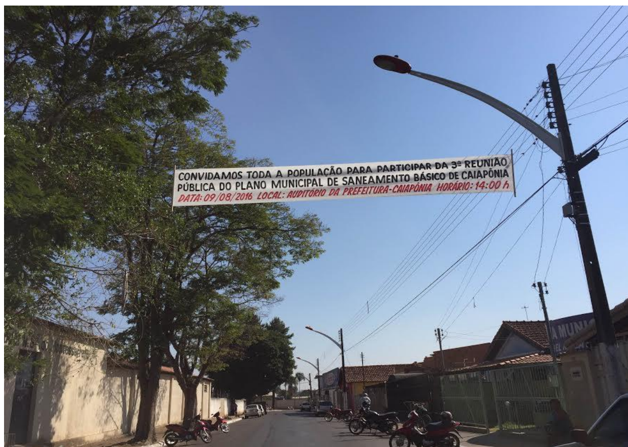
Figura 4. Faixa anexada no centro de Caiapônia.

Também foram utilizadas faixas com intuito de ampliar a abrangência da divulgação das reuniões referentes ao Plano Municipal de Saneamento de Caiapônia. A figura abaixo ilustra a faixa inserida em uma via de bastante movimento no perímetro urbano de Caiapônia.