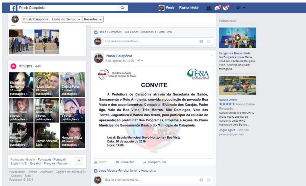
Figura 3. Convite na página do facebook para a reunião em Boa Vista.