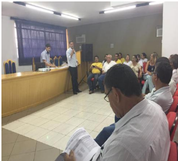
Figura 9. Representante da Secretaria de Saúde.