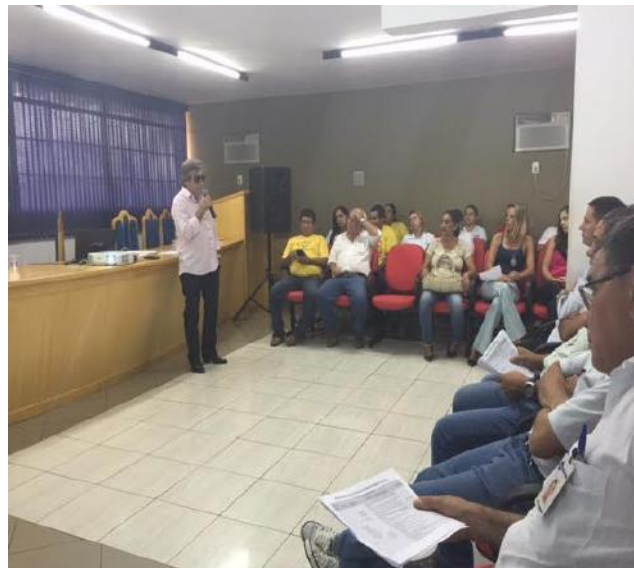
Figura 10. Representante da FUNASA.