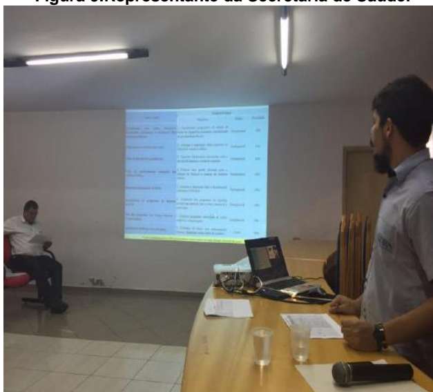
Figura 11. Representante da Terra Consultoria.