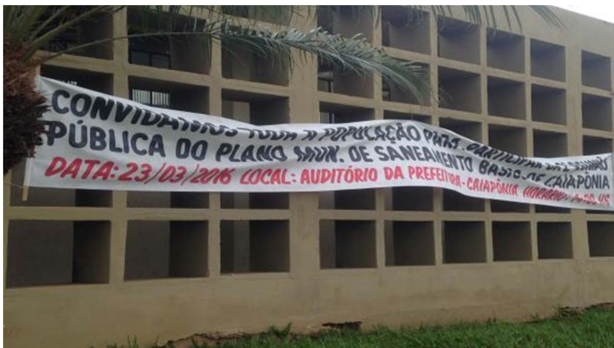
Figura 126. Faixa convidando a população de Caiapônia para a reunião do Prognóstico.

Outro método de divulgação, foram faixas confeccionadas com o intuito de atingir todo o público de Caiapônia, no total foram feitas três faixas, como mostram as figuras abaixo.