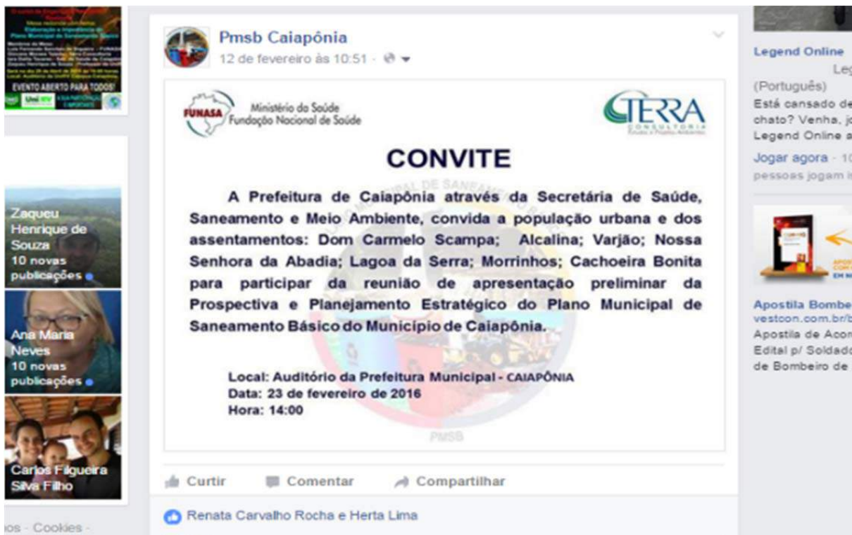
Figura 130. Convite da reunião do Produto D na zona urbana publicado na página do facebook de Caiapônia.