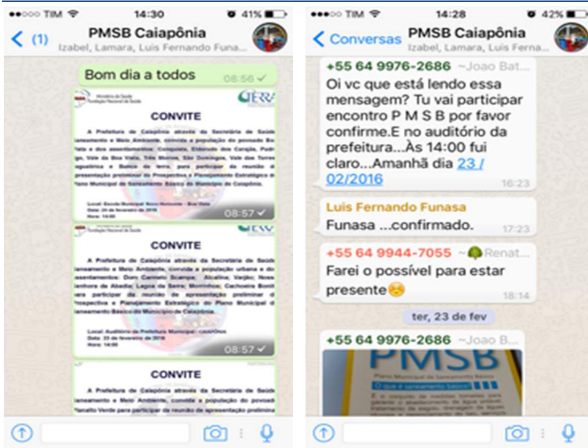
Figura 129 Conversa no grupo no whatsapp do PMSB de Caiapônia.

Outra rede social utilizada foi a página no facebook do PMSB de Caiapônia, a partir do dia 12 de fevereiro de 2016 foram divulgados os convites na página que atualmente conta com 447 amigos, ampliando a abrangência da divulgação do evento.