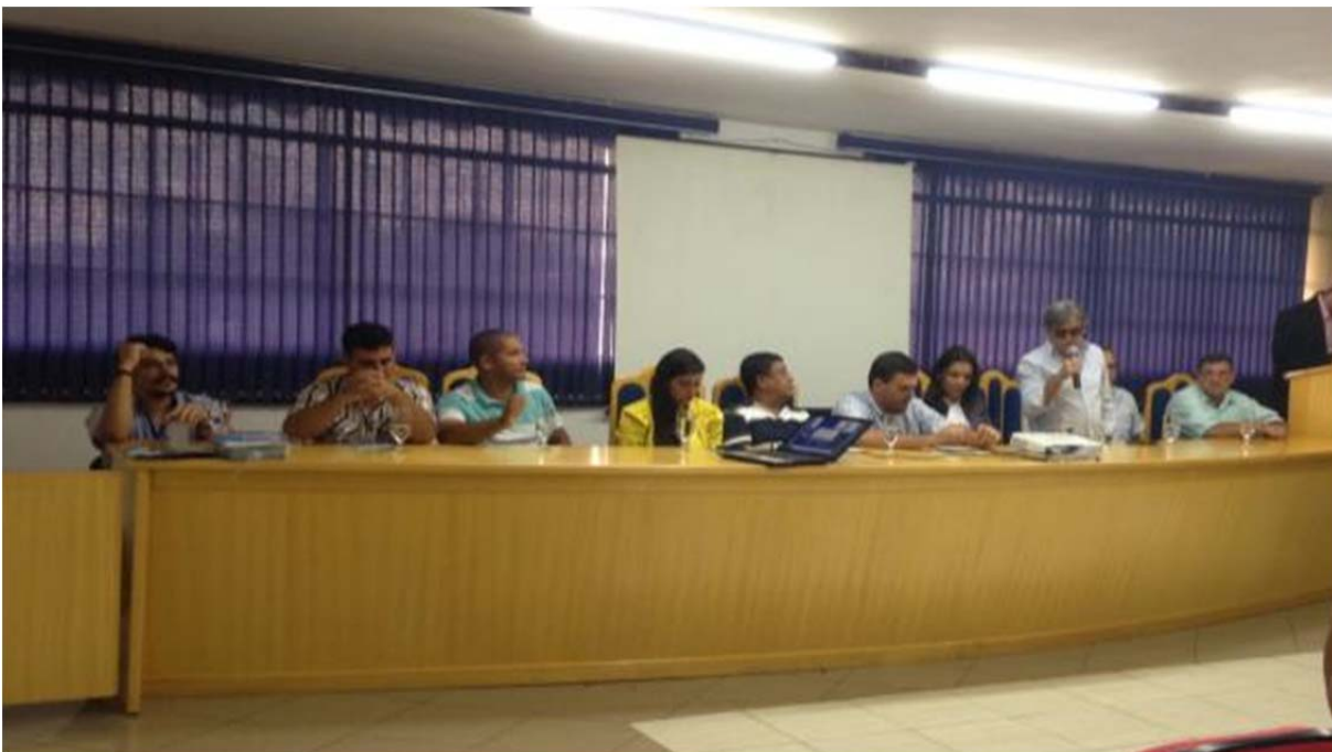
Figura 133. Representante da FUNASA explanando sobre o PMSB.

As autoridades presentes falaram sobre a importância do saneamento e consequentemente do PMSB, além da importância e papel da população em cada etapa da elaboração do mesmo, como mostra a figura abaixo.