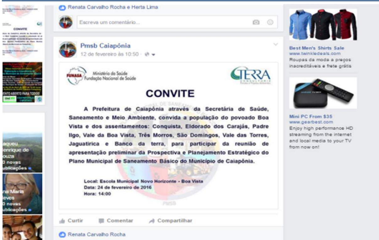
Figura 132. Convite da reunião do Produto D na zona rural publicado na página do facebook de Caiapônia.