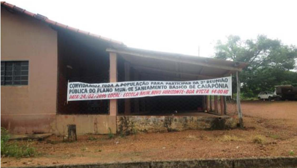
Figura 127. Faixa convidando a população do povoado Boa Vista e Região para a reunião do Prognóstico.