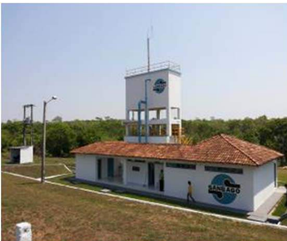
Figura 112. Vista geral da ETA.

A segunda visita ocorreu na ETA, onde se pode observar desde a captação até a água tratada. Foi possível acompanhar a manutenção dos filtros, pois no dia da visita, coincidiu de os técnicos estarem desenvolvendo este trabalho.