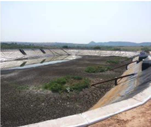
Figura 110. Lagoa Anaeróbia B desativada.