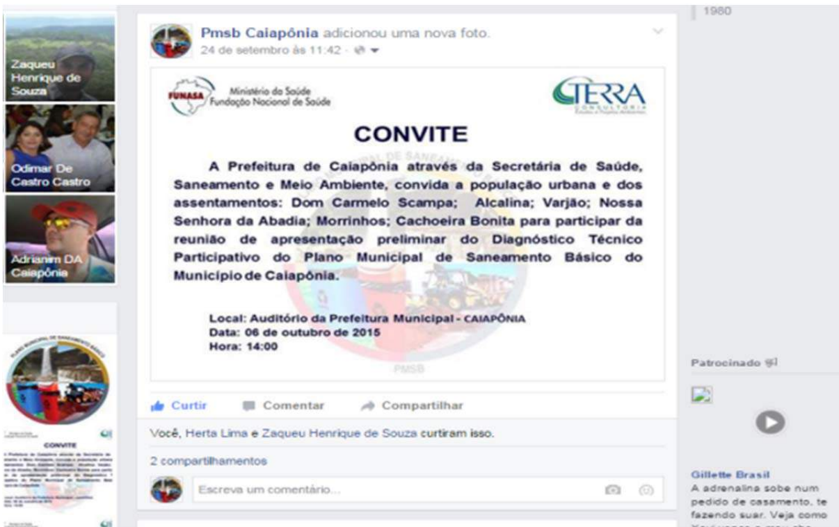
Figura 105 - Convite para a reunião na sede de Caiapônia na página do facebook do PMSB de Caiapônia.

A metodologia das mobilizações seguiu o Plano de Mobilização Social, foram distribuídos convites impressos, enviados convites em formato digital na página do facebook de Caiapônia, como ilustram as figuras a seguir.