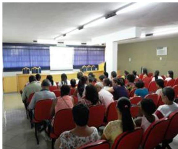
Figura 115. Reunião de Diagnóstico.

Após a formação da mesa de autoridades, alguns de seus integrantes falaram sobre o Plano Municipal de Saneamento de Caiapônia e logo se deu início à apresentação de fato, posterior a explanação sobre abastecimento de água, esgotamento sanitário, manejo de águas pluviais e limpeza urbana e manejo de resíduos sólidos de Caiapônia, as pessoas presentes foram instigadas a participar com sua opinião a respeito de cada vertente.