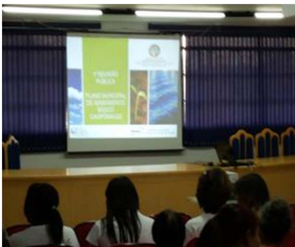
Figura 114. Slide inicial da apresentação.