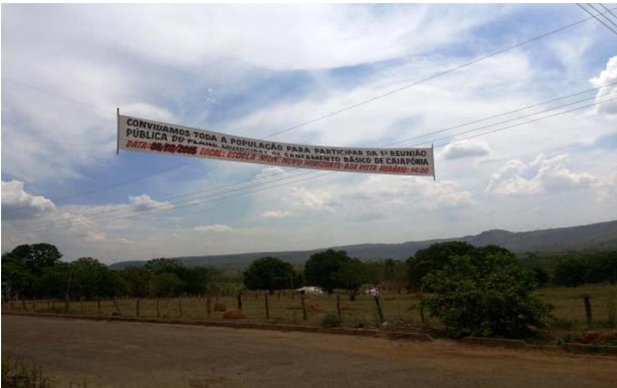
Figura 108. Faixa de divulgação da reunião no povoado Boa Vista.

No que se referem as demais faixas, as mesmas também foram enviadas a prefeitura, porém quando a equipe chegou à sede de Caiapônia e no Povoado Planalto verde, não foi possível encontra-las, segundo a Secretaria de Saúde, Saneamento e Meio Ambiente, ambas foram fixadas em pontos estratégicos, porém um dia antes da reunião, caíram e não se pode incluí-las no registro fotográfico.