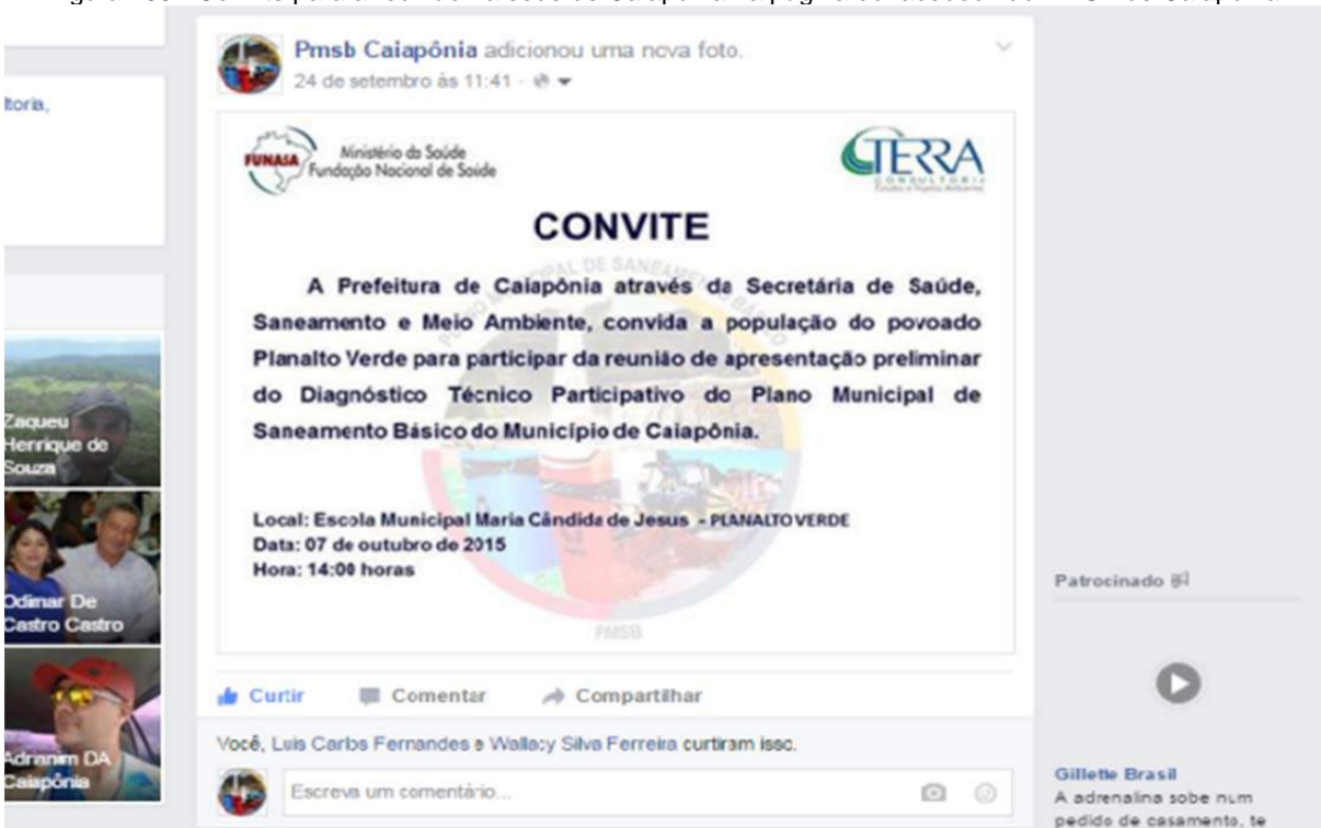
Figura 106 – Convite para a reunião no Planalto Verde na página do facebook do PMSB de Caiapônia.