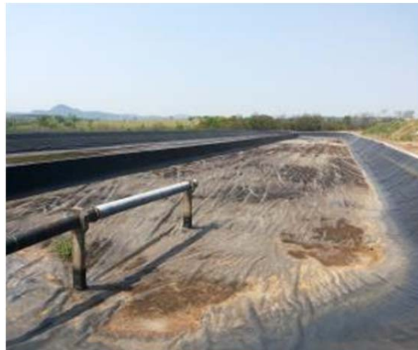
Figura 111. Lagoa Facultativa 2 desativada.

A segunda visita ocorreu na ETA, onde se pode observar desde a captação até a água tratada. Foi possível acompanhar a manutenção dos filtros, pois no dia da visita, coincidiu de os técnicos estarem desenvolvendo este trabalho.