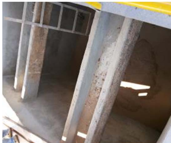
Figura 113. Filtros passando por manutenção.